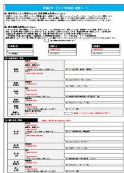
【3年保証登録シート】